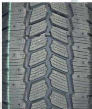
205/65 R16C SNOW + ICE

Die vorgestellten Prüfreifen wurden im Heißverfahren in der oben näher benannten Produktionsstätte hergestellt.